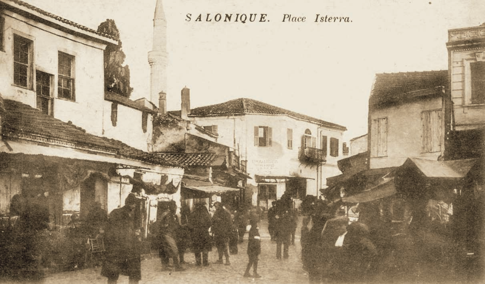
Η αγορά των δημητριακών στο λιμάνι της Θεσσαλονίκης (Ιστιρά). Αρχές 20ού αιώνα.