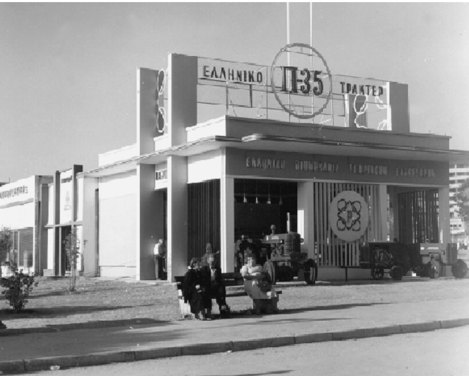
Η ανάπτυξη της ελληνικής γεωργίας κατέστησε συμφέρουσα την εγχώρια συναρμολόγηση γεωργικών ελκυστήρων (1961)