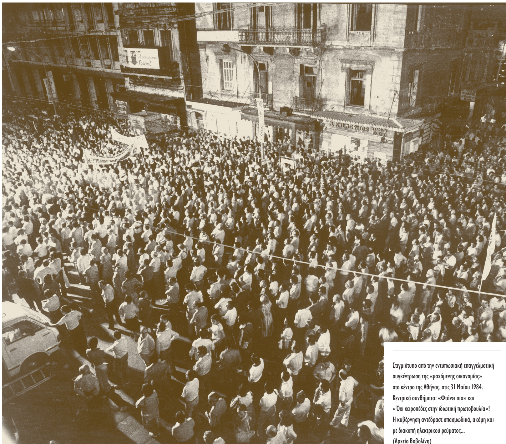
Στιγμιότυπο από την εντυπωσιακή επαγγελματική συγκέντρωση της «μαχόμενης οικονομίας» στο κέντρο της Αθήνας, στις 31 Μαΐου 1984. Κεντρικά συνθήματα: «Φτάνει πια» και «Όχι χειροπέδες στην ιδιωτική πρωτοβουλία»! Η κυβέρνηση αντέδρασε σπασμωδικά, ακόμη και με διακοπή ηλεκτρικού ρεύματος...