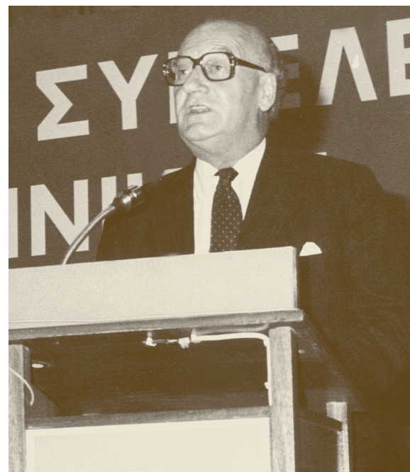
Στην ανοικτή συνεδρίαση του ΣΕΒ, στις 16 Μαΐου 1985, συμμετείχε και ο πρόεδρος της UNICE λόρδος Ray Pennock, ο οποίος, σκιαγραφώντας τις θέσεις της UNICE, καταδίκασε τους μηχανισμούς πολλαπλών ελέγχων και επεμβάσεων στην αγορά.

Οι προτάσεις του ΣΕΒ για την αποτελεσματική αντιμετώπιση της οικονομικής κρίσης διατυπώθηκαν ως σχέδιο για μια «σωστή αναπτυξιακή πολιτική», το οποίο συμπύκνωνε, εξάλλου, όλα τα αιτήματα του βιομηχανικού κόσμου στην τρικυμιάδη αυτή περίοδο. Πράγματι, το διάστημα αυτό ο Ανδρέας Παπανδρέου, ύστερα από την εκλογική νίκη της 2ας Ιουνίου 1985, προέβη σε θεαματικό ανασχηματισμό στις 26 Ιουλίου, αντικαθιστώντας τον Γεράσιμο Αρσένη –ο οποίος θα διαγραφεί από το ΠΑΣΟΚ το 1986– με τον Κωνσταντίνο Σημίτη στο νευραλγικό υπουργείο Εθνικής Οικονομίας. Τον Οκτώβριο δε η κυβέρνηση εξήγγειλε μέτρα λιτότητας που συνόδευσαν την υποτίμηση της δραχμής κατά 15%. Υπό αυτές τις συνθήκες, ο Σύνδεσμος θεωρούσε ότι προϋποθέσεις μιας υγιούς αναπτυξιακής πολιτικής αποτελούσαν ο περιορισμός του δημόσιου τομέα και η ουσιαστική ενθάρρυνση του ιδιωτικού. Εξίσου επιτακτική πρόβαλε η ανάγκη «αποδέσμευσης του κράτους από δραστηριότητες», στις οποίες άλλωστε «αποδεδειγμένα υστερούσε»... 8