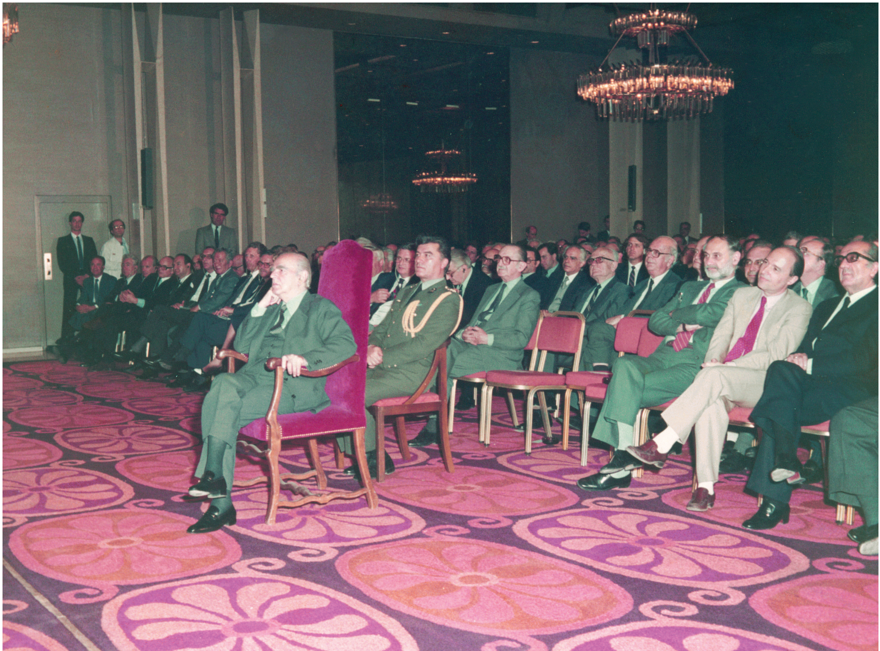
Η γενική συνέλευση του ΣΕΒ, στις 15 Μαΐου 1984, επανεξελέξε πρόεδρο τον Θεόδωρο Παπαλεξόπουλο. Η ανοιχτή συνεδρίαση πραγματοποιήθηκε παρουσία του Προέδρου της Δημοκρατίας, Κωνσταντίνου Καραμανλή. Ο Θ. Παπαλεξόπουλος στην ομιλία του αναφέρθηκε στο διάλογο βιομηχανίας-κυβέρνησης, σημειώνοντας ότι «οι τοποθετήσεις δεν συναντήθηκαν συχνά».