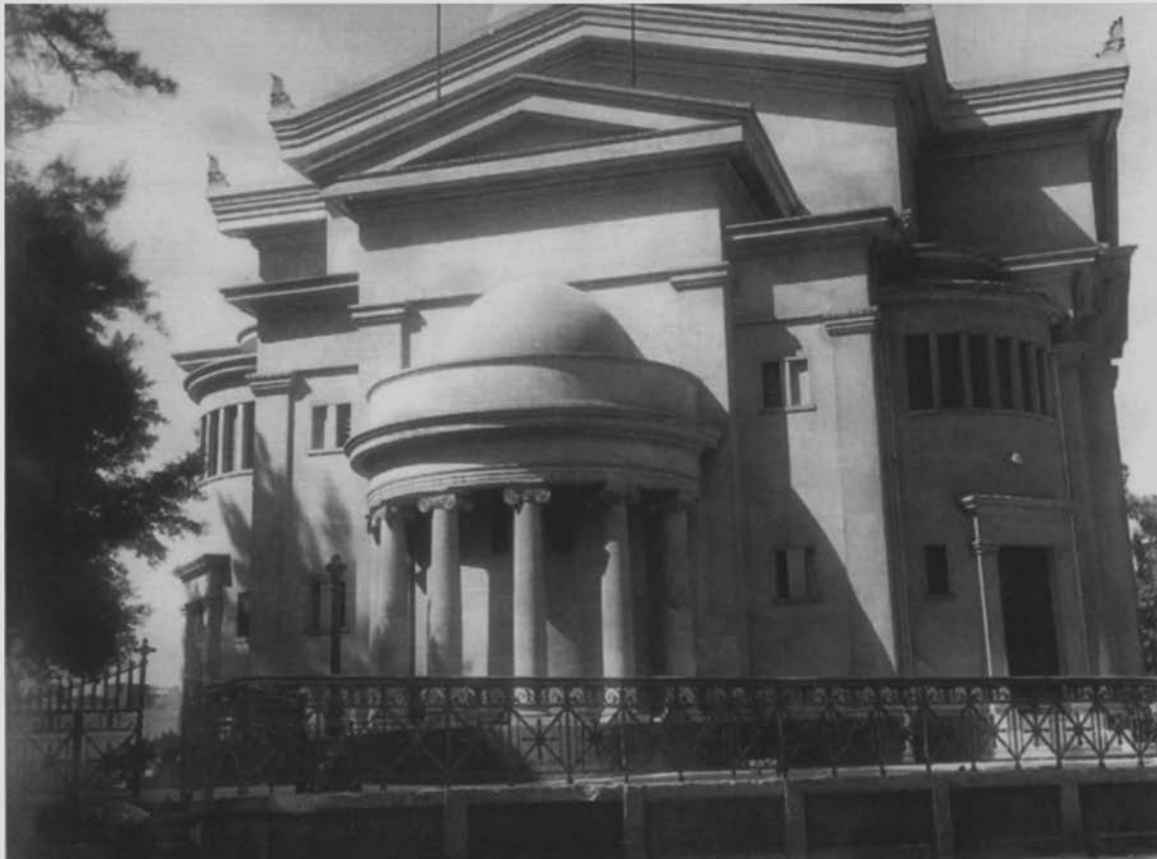
Ο ναός των Αγίων Κωνσταντίνου και Ελένης στο Κάιρο, που εγκαινιάστηκε το 1914, παρόντος του Πατριάρχου Φωτίου. (Αρχείο ΕΛΙΑ)