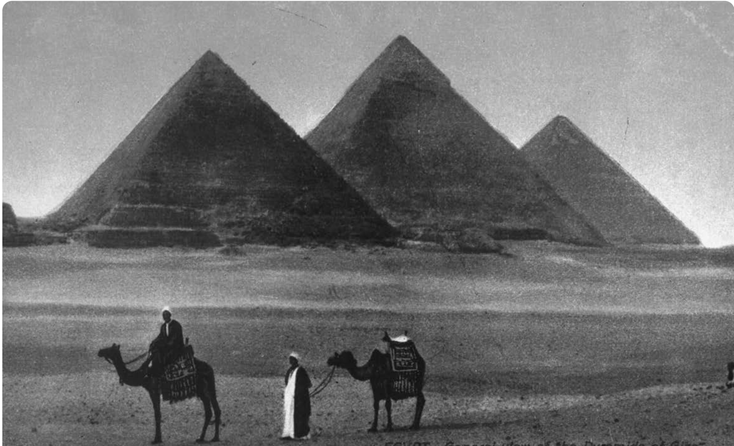
Οι πυραμίδες της Γκίζας, ένα από τα επτά θαύματα του αρχαίου κόσμου.