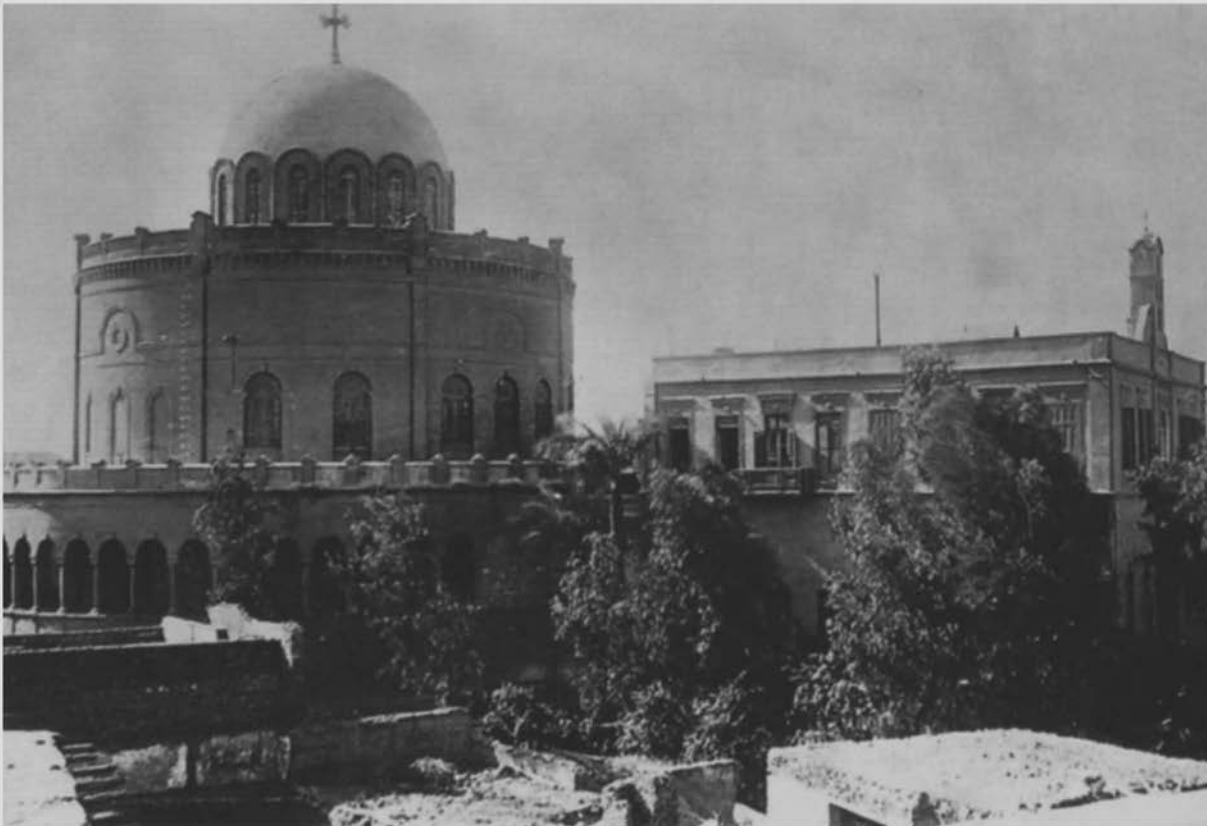
Ο ναός του Αγίου Γεωργίου στο Παλιό Κάιρο. Καταστράφηκε από πυρκαγιά το 1904 και αναστηλώθηκε το 1948 από τον πρόεδρο της Ελληνικής Κοινότητας Καΐρου, Θεόδωρο Π. Κότσικα.