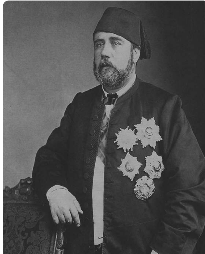
Ισμαήλ ο Μεγαλοπρεπής. Στα χρόνια του έγινε η διάνοιξη της Διώρυγας του Σουέζ, καθώς και πολλά δημόσια και πολιτιστικά έργα. (Αρχείο ΕΛΙΑ)

«Είσθε υπόδουλοι ζημιωμένοι εις τας επιχειρήσεις σας και εις τα κέρδη σας και είσθε υποδεέστεροι όσον αφορά τους φόρους της ζωής. Τούτο όμως προέρχεται από τους ξένους και όχι μόνο από τους Άγγλους. Τι σας έμεινε λοιπόν εις την Αίγυπτον; Σας έμεινε μια μπουκιά ψωμιού εις την οποίαν καταπαύετε την πείναν σας εις το τέλος της ημέρας. Αλλ' άραγε η ζωή δεν έχει ηδονήν υψηλοτέραν ή πόθον