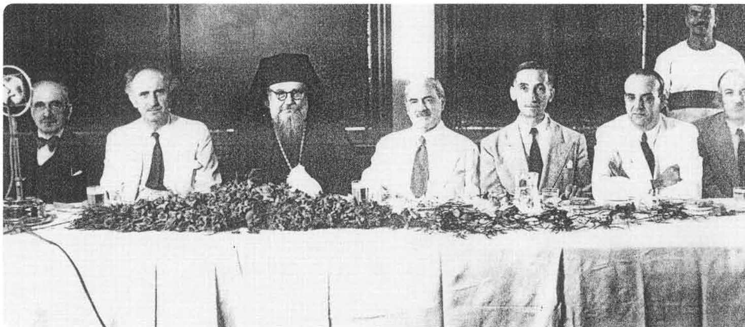
Τιμητική εκδήλωση προς τον Μικέ Σαλβάγο, το 1944. Διακρίνονται από αριστερά οι: Γεώργιος Παπανδρέου, Πατριάρχης Αλεξανδρείας Χριστόφορος, Μικές Σαλβάγος.

της Κοινότητας Αλεξανδρείας, καλύπτοντας περίπου τριάντα χρόνια κοινοτικής πορείας. Στο τιμητικό γεύμα που δόθηκε στο Καζίνο Σάτμπυ, την Κυριακή 15 Ιουλίου 1944, για τον εορτασμό της εικοσιπενταετηρίδος της προεδρίας του, ο λόγος του παρόντος πρωθυπουργού Γεωργίου Παπανδρέου