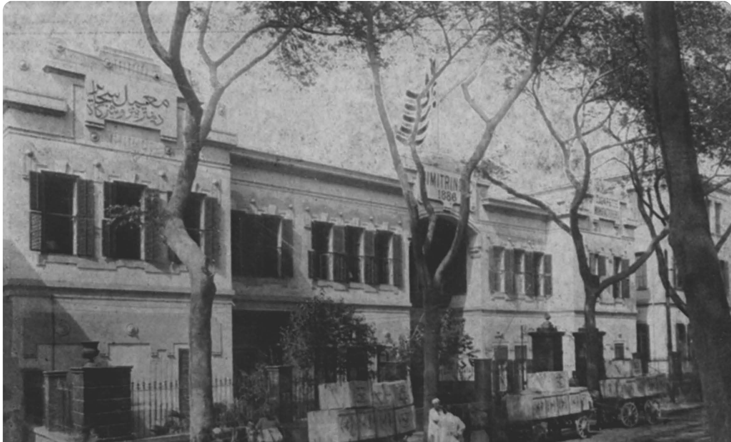
Γενική άποψη του εργοστασίου Δημητρίνο και Σια στο Κάιρο. (Α. Γ. Πολίτης, Ο Ελληνισμός και η νεωτέρα Αίγυπτος , β' τόμος, 1930 - Αρχείο Βοβολίνη)